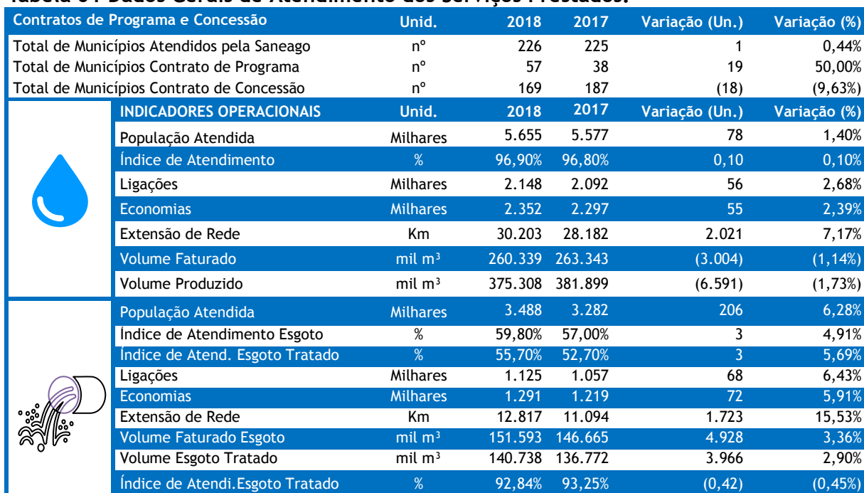
Tabela 01 Dados Gerais de Atendimento dos Serviços Prestados.